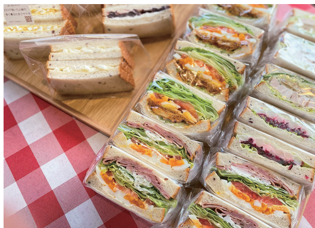
（例）お店のイチオシ商品